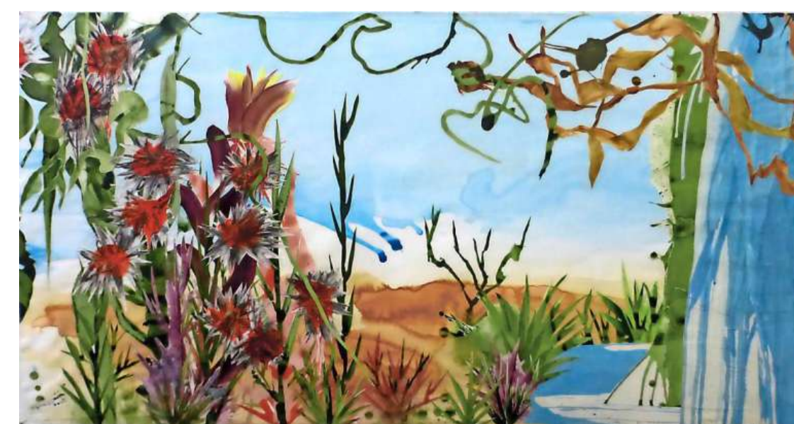
The Wild Last Frontier, 2022, 76 x 144 cm, acryl, papiercollage. (Ronald Ruseler)

Tentoonstelling Ronald Ruseler, Onvoltooide Tuin | Transit, deel 1, galerie Kruis-Weg68, Kruisweg 68, Haarlem. Duur van de expositie: 2 tot en met 24 september. Opening vrijdag 2 september 11.00-18.00 uur. Dan is Ronald Ruseler aanwezig.