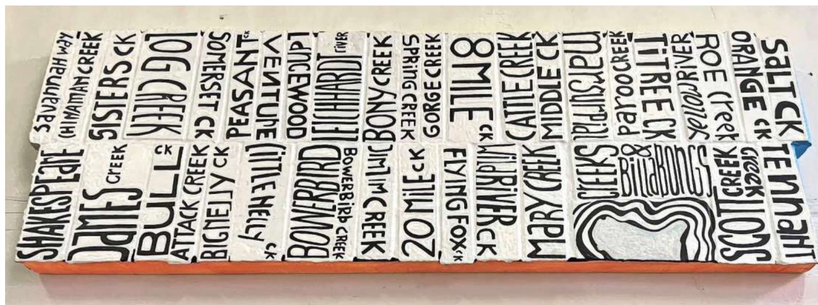
Letterschildering met de namen van krekken in Australië.

„ Ik was gevangen door indrukken. Ik kon er echt niet tegenop