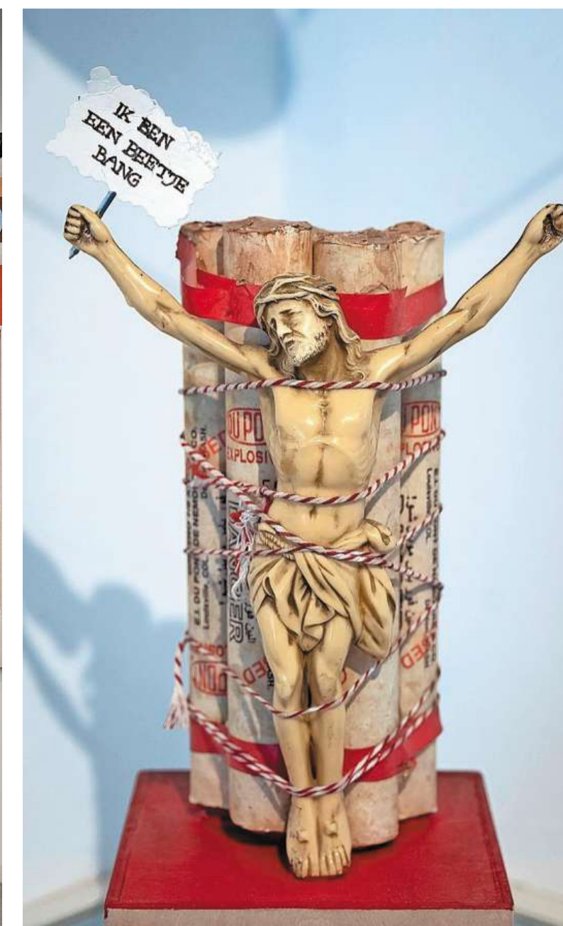
Religie is een van de thema's in deze expositie