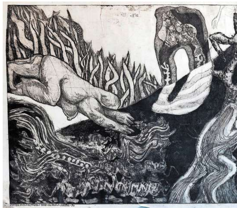
Seksualiteit speelt een rol in de vroege etsen

INTERVIEW Expositie over religie, seks en macht