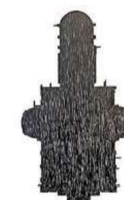
Venetiaanse kerk vlakbij Peggy Guggenheim Museum.