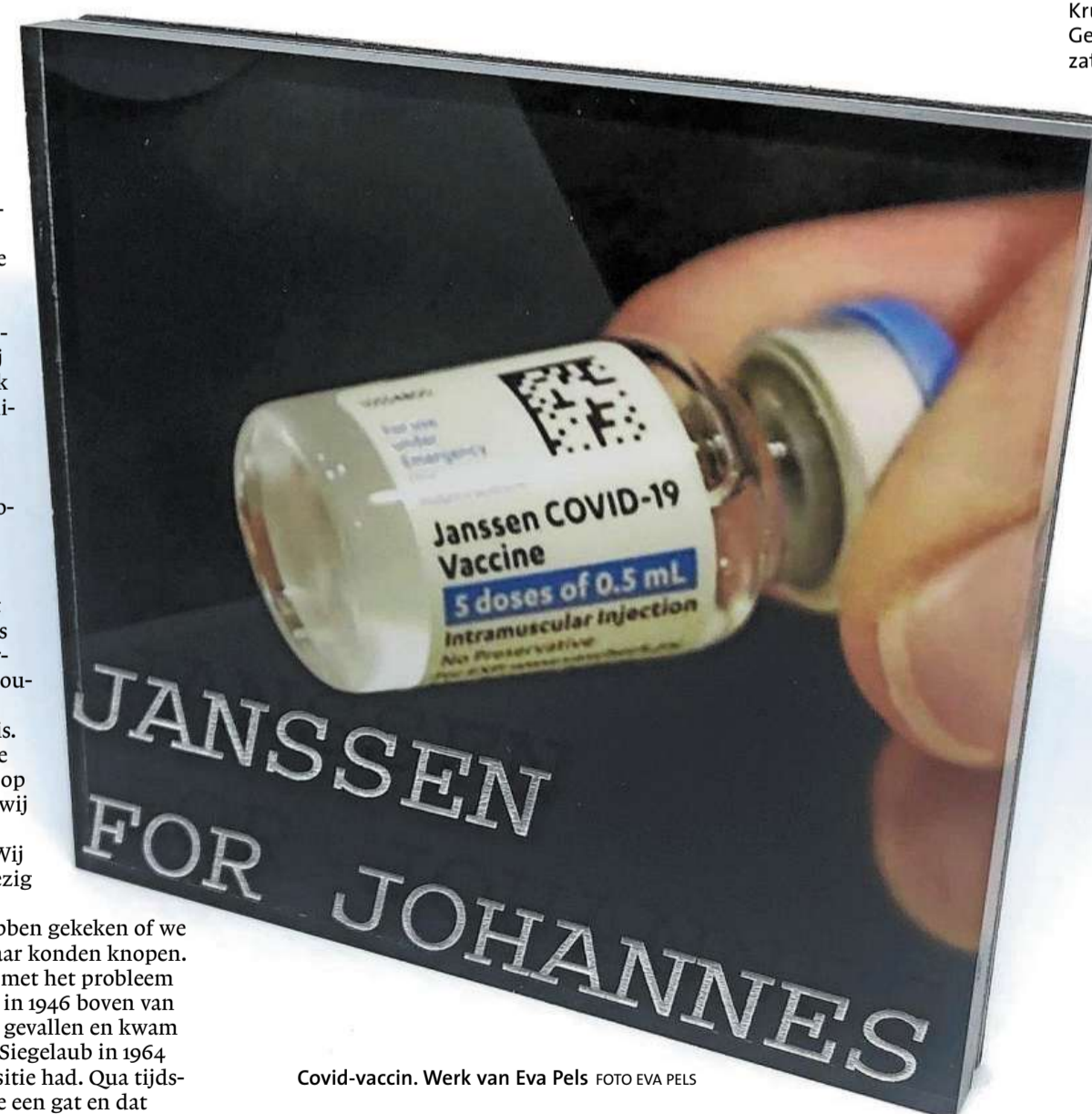
Covid-vaccin. Werk van Eva Pels FOTO EVA PELS

Guggenheim of Siegelaub op staan afgebeeld, maar ook tekeningen van gebouwen die een belangrijke rol spelen in het leven van bijvoorbeeld Guggenheim.