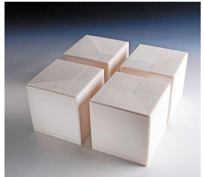
Cube Series 2020. Werk van Wim Borst.