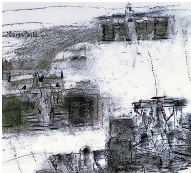
Race-auto's. Werk van Jaap Ploos van Amstel.